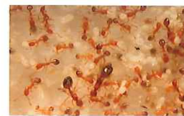
イエヒメアリ(コロニー)