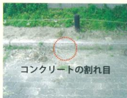
コンクリートの割れ目