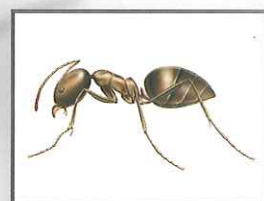
アルゼンチンアリ