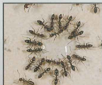
アルゼンチンアリ