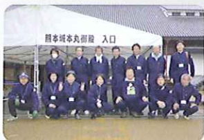
熊本城施エスタッフ

エコボロン®PRO は専門知識を持った認定施工店が、高品質な施工を実施いたします。