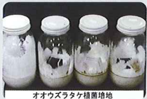
オオウズラタケ培養培地

エコボロン®PRO は木材腐朽菌にも強力な効果があり、またカビ菌の繁殖も抑制します。 エコボロン®PRO は京都大学、東京農業大学、(財)建築研究協会などで防腐性能が確認されています。