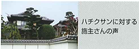
ハチクサンに対する 施主さんの声

主成分イミダクロプリドはシロアリに対して忌避性(シロアリが薬剤を避ける作用)がありません。処理をした場所でもシロアリは接近し、薬剤に接触します。シロアリはその習性から仲間同士で薬剤を他の仲間にも波及させていきます。散布後、徐々に動きが鈍くなり、木材などを加害する能力を失い、やがて死に至ります。