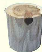
サブステックウッド