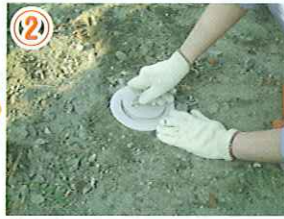
② 検査時はステーションの蓋を開ける