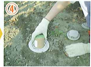
④ シロアリを検知したらベイトを入れる