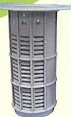
サブステックステーション

シロアリの生態を熟知した専門業者が、ステーション・ボックス・ベイトの3種類の装置を用い、大切な建物の維持管理を行います。