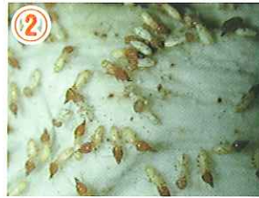
② ベイトを与えるとシロアリの体色が白っぽくなる