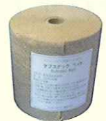
サブステックベイト