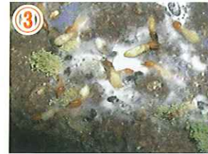
③ その後、シロアリが死亡する