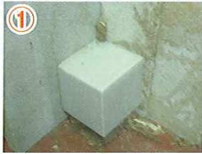
① 蟻道に沿ってボックスを設置する