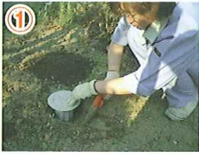
① ステーションを埋設する