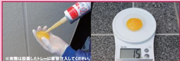
※実際は設置したトレーに直接注入してください。

バードフリーをトレーに約15g注入。(本製品1本で約16個分注入できます。)(直線に施工した場合約3m処理できます。) ※トレーの設置が困難な場合は、本製品を直接施工するか、フックを使用して下さい。