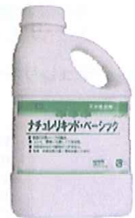
荷 姿 1L ボトル×6本