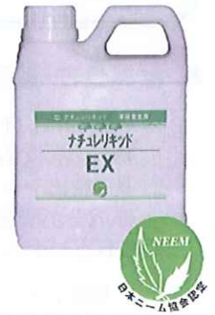
荷 姿 1L ボトル×6本

有効成分アザディラクティンは、昆虫が発育していく過程における昆虫特有の生理(脱皮、蛹化、羽化、産卵等)を阻害する事で殺虫効果を発現します。従来の神経毒性の殺虫剤による対処療法使用方法と異なり、「漢方薬」「予防薬」と同じで、定期的・継続的に使用することで虫のいない(少ない)環境を創り出します。